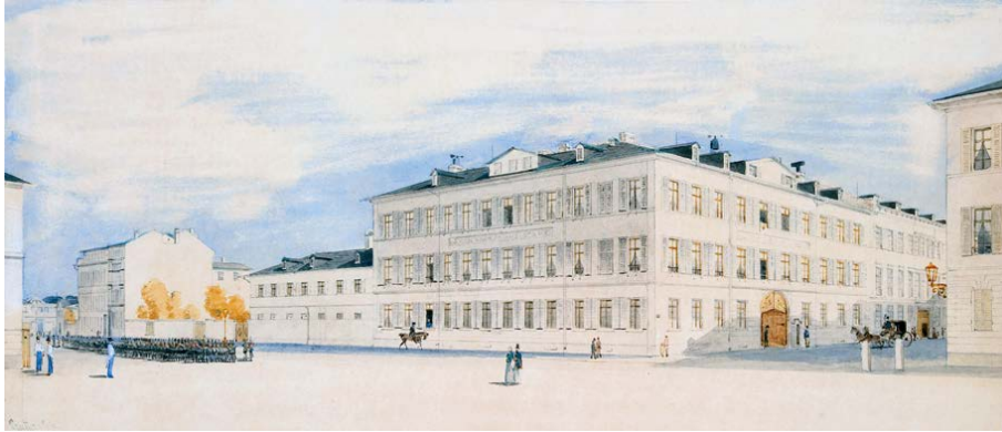
Bankhaus Metzler in der Großen Gallusstraße in Frankfurt am Main, Anfang 19. Jahrhundert