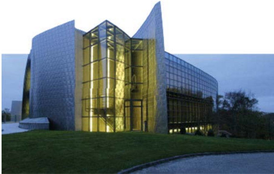
Das Bürogebäude von Fidelity und der FFB in Kronberg im Taunus